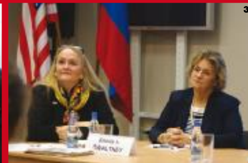
1. 21 октября 2019 года в рамках сотрудничества с Североамериканским консульством в Санкт-Петербурге факультет посетили представители консульства и сотрудники консульского отдела консульства в Санкт-Петербурге. 2. 17 октября 2019 года состоялось заседание факультета ЯО. 3. Встреча с представителями консульства в Санкт-Петербурге. 4. 22 октября 2019 года факультет посетили представители консульства в Санкт-Петербурге. 5. 20 октября 2019 года факультет посетили представители консульства в Санкт-Петербурге.