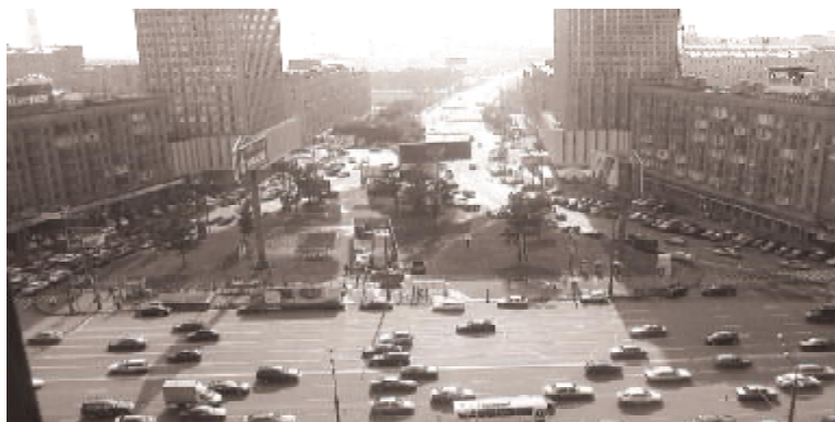
■ Вид из здания окна МИДа РФ Москва

мучающий меня вот уже четвертый год вопрос «Что такое дипломатия, и кто такие дипломаты?». В этом смысле из МИДа я увез очень ценные знания.