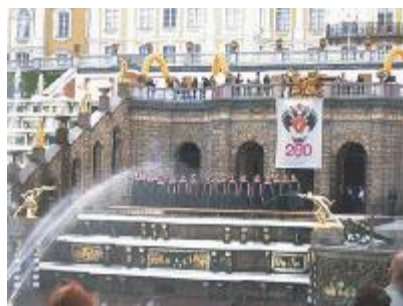
■ Петродворец. Выступает хор Университета