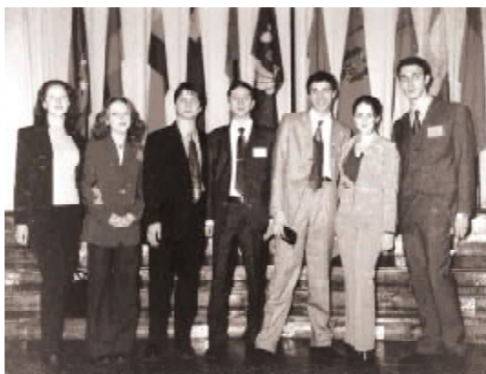
Первые модели организационного комитета. Санкт-Петербург, Таврический Дворец

Игра имеет статус научно-практической конференции, поскольку подразумевает: серьезную подготовку делегата по актуальным вопросам повестки дня ООН, обсуждение ключевых вопросов современных международных отношений