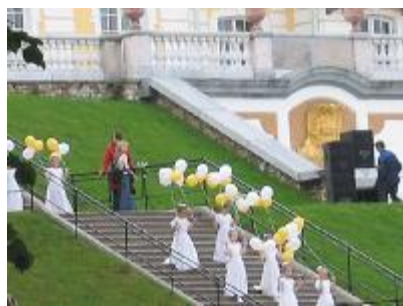
■ Большая лестница в Петродворце Праздник в разгаре