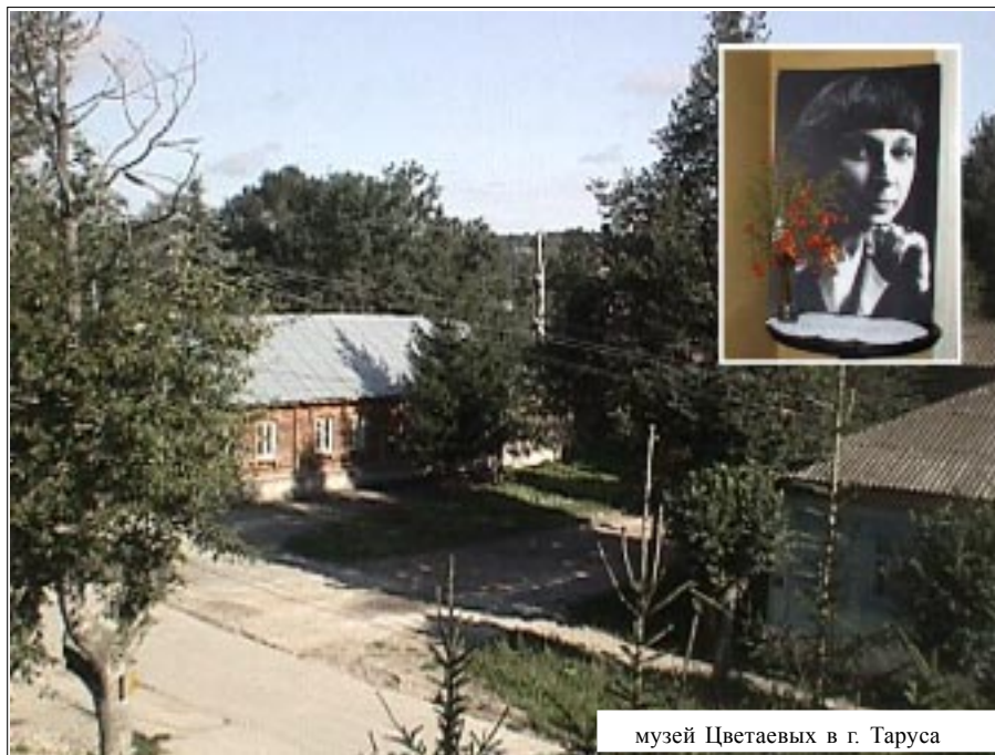
музей Цветаевых в г. Таруса

От конкретных проблем маленького поселка мы дошли до глобальных вопросов,