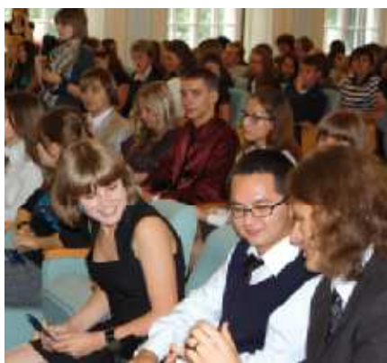
На фото: факультет становится ближе

Факультет международных отношений Санкт-Петербургского государственного университета рад сообщить о проведении традиционных зимних дней открытых дверей. День открытых дверей - это хороший шанс познакомиться с факультетом, пообщаться с преподавателями и руководителями программ и получить ответы на интересующие вопросы о факультете.