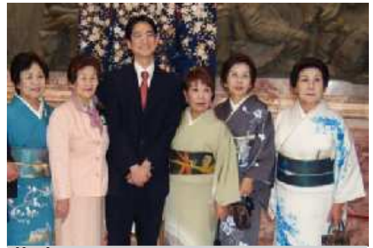
На фото: японская делегация в Северной Венеции

Фестиваль этого года для меня был особенным. Впервые, потому, что я смогла поделиться впечатлениями не только со своими однокур-