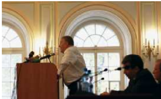
На фото: лидер ЛДПР за трибуной