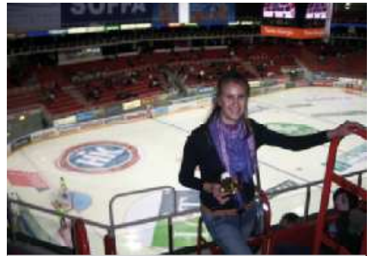
На фото: международные спортивные связи в действии

В этот год России в Турку еще больше, чем всегда. В празднование 200-летия финской автономии (1809-2009) Турку вносит особый вклад. Темой ежегодной книжной ярмарки Турку в октябре – одного из главных культурных событий года – в 2009 году стал Санкт-Петербург. В тот же период прошли насыщенные Дни Санкт-Петербурга в Турку (1-4 октября). В рамках Дней представители Петербурга передали в дар библиотеке Турку коллекцию из более чем 300 книг. Петербург привез с собой в Турку писателей, музыкантов и артистов. Состоялся и ряд встреч представителей деловых кругов. Дни Петербурга в Турку стали ярким событием в жизни города,