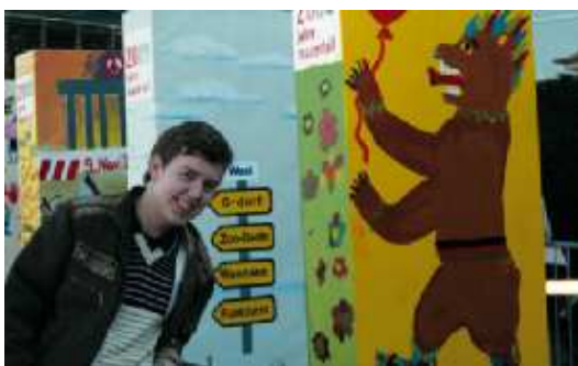
На фото: немецкий медведь и российский студент

Шесть недель в прекрасном городе Бремен довольно быстро подошли к концу. Однако, оглядываясь назад, я понимаю, что это время стало для меня своего рода «маленькой жизнью» с огромным количеством новых эмоций, впечатлений и открытий. И даже когда после этого возвращаешься в Россию, начинаешь по-другому смотреть на некоторые вещи, раньше казавшиеся совершенно обычными. Зарубежная стажировка — отличный шанс привнести в свою жизнь что-то совершенно новое и интересное. ■