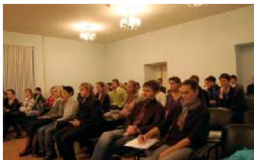
На фото: интерес к российско-шведскому партнерству

студентка 1 курса направления "Регионоведение"