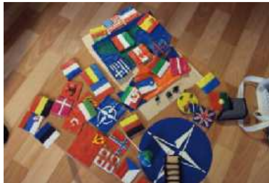
На фото: все флаги будут...изучены на факультете

студентка 3 курса направления «Международные отношения»