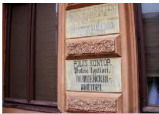
На фото: Турку - самый русский город Финляндии

магистрантка 1 курса магистерская программа "Исследования региона Балтийского моря"