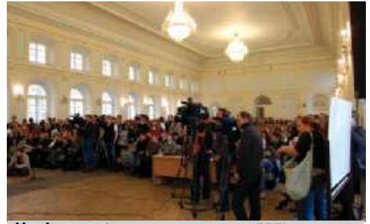
На фото: в фокусе внимания - лидер ЛДПР

Была затронута и тема «хорошего» политика и того, каким он должен быть. «Мудрый руководитель тот, при котором нет войны» - считает Владимир Вольфович, и такие великие деятели в истории России, как император Николай II и Иосиф Виссарионович Сталин, были ужасными правителями, так как вязали страну в Мировые войны, тогда как этого можно было и избежать. А вообще, «каждый политик должен быть и юристом, и