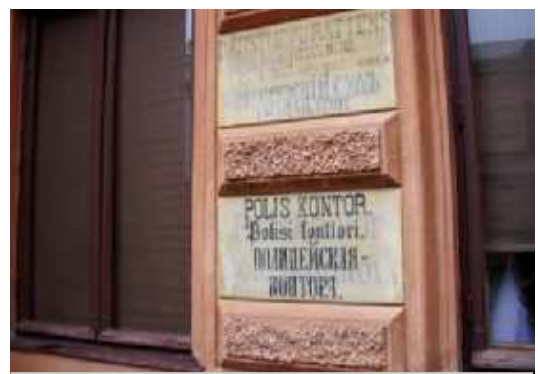
На фото: Турку - самый русский город Финляндии

магистрантка 1 курса магистерская программа "Исследования региона Балтийского моря"