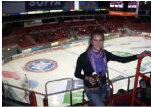
На фото: международные спортивные связи в действии

В этот год России в Турку еще больше, чем всегда. В празднование 200-летия финской автономии (1809-2009) Турку вносит особый вклад. Темой ежегодной книжной ярмарки Турку в октябре – одного из главных культурных событий года – в 2009 году стал Санкт-Петербург. В тот же период прошли насыщенные Дни Санкт-Петербурга в Турку (1-4 октября). В рамках Дней представители Петербурга передали в дар библиотеке Турку коллекцию из более чем 300 книг. Петербург привез с собой в Турку писателей, музыкантов и артистов. Состоялся и ряд встреч представителей деловых кругов. Дни Петербурга в Турку стали ярким событием в жизни города,