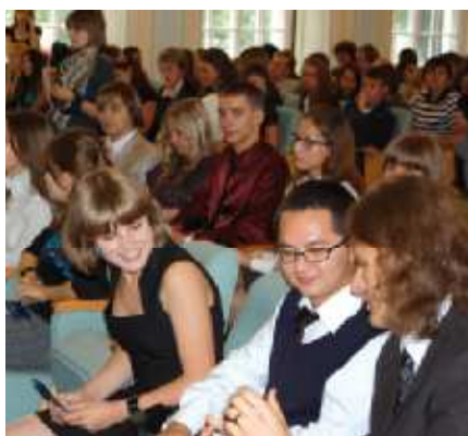
На фото: факультет становится ближе

Факультет международных отношений Санкт-Петербургского государственного университета рад сообщить о проведении традиционных зимних дней открытых дверей. День открытых дверей - это хороший шанс познакомиться с факультетом, пообщаться с преподавателями и руководителями программ и получить ответы на интересующие вопросы о факультете.