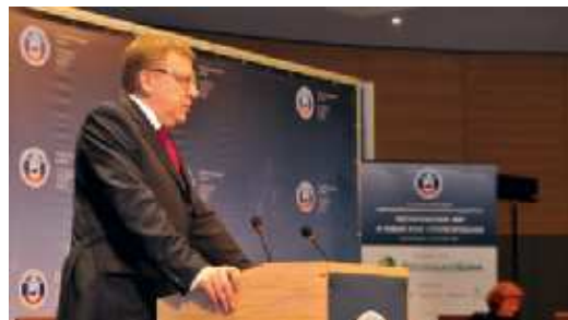
На фото: выступление А. Л. Кудрина на форуме

Интересным для получения новых профессиональных знаний, необходимых международнику, стало для нас изучение международного опыта стратегического планирования, который обсуждался на круглом столе под председательством генерального директора МЦСЭИ «Леонтьевский центр»