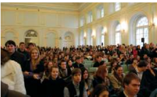
На фото: сотни слушателей пришли на лекцию