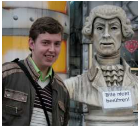
На фото: встреча истории и современности

студент 3 курса направления «Международные отношения»