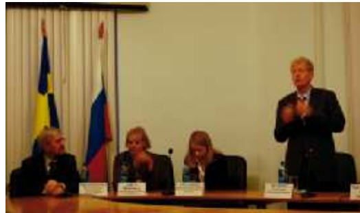
На фото: губернатор региона Стокгольм Пер Ункель

Было отмечено, что хотя произошедший мировой финансовый кризис затрудняет эту деятельность, можно с уверенностью сказать, что она ведется, и оказывает