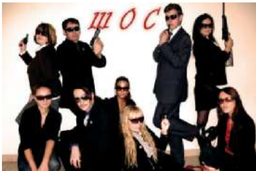
На фото: ...и превосходный результат!

Игра на факультете проходит на высоком уровне