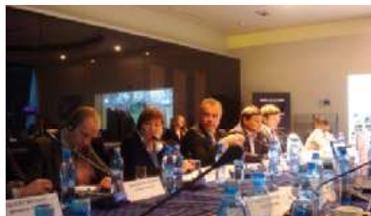
На фото: стратегическое партнерство наглядно

О деятельности молодежи в области партнерства России и Германии рассказала в своем кратком выступлении автор