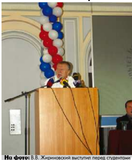
На фото: В. В. Жириновский выступил перед студентами