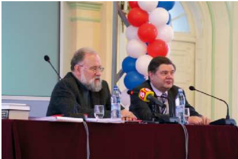
На фото: председатель ЦИК РФ В. Е. Чуров и декан факультета К. К. Худoley

"Я деполитизированный человек, - отметил В. Е. Чуров в своем выступлении, - я заинтересован лишь в том, чтобы соблюдался закон, а мне пытаются навязать политику"