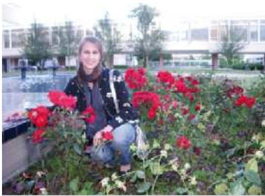
На фото: практика - это прекрасно

В завершение не могу не воспользоваться шансом передать самые теплые приветствия своим друзьям, коллегам и преподавателям на факультете международных отношений, и пожелать им больших успехов. ▀