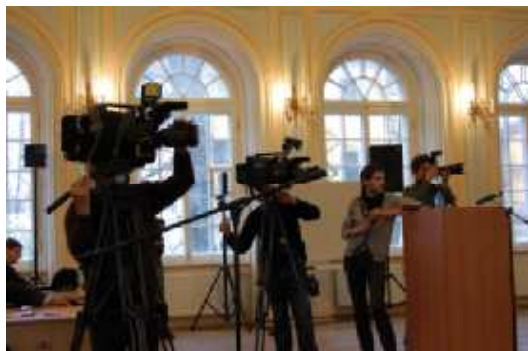
На фото: внимание СМИ приковано к факультету

..В.Е.Чуров уделит особое внимание необходимости вводить новые технологии голосования, например, электронное или смс голосование..