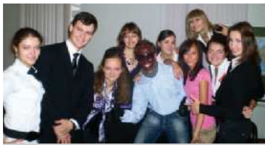
На фото: студенты демонстрируют творческий подход..

..каждый раз я понимаю, что студенческая фантазия безгранична..