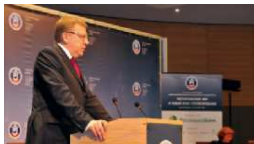
На фото: выступление А. Л. Кудрина на форуме

Интересным для получения новых профессиональных знаний, необходимых международнику, стало для нас изучение международного опыта стратегического планирования, который обсуждался на круглом столе под председательством генерального директора МЦСЭИ «Леонтьевский центр»