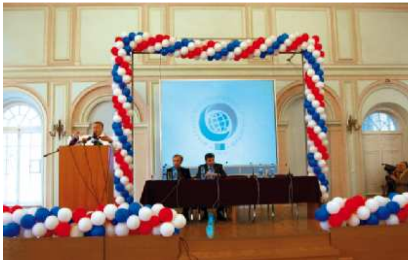
На фото: В. В. Жириновский представил студентам альтернативный взгляд на историю

Всем платят за то, чтобы они читали лекции. А мне платят 30 000 долларов, чтобы я их не читал. Видите, какой я хороший!