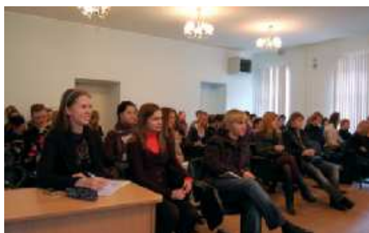
На фото: интересной лекции - полный зал слушателей

Таким образом, на нынешнем этапе развития Трансатлантического партнерства Германии и США эксперт видит хорошие для Германии перспективы по увеличению веса своей политики и своего участия в принятии общих решений как в глобальном, так и в европейском измерении. И эти перспективы, вероятно, имеют для Германии большее значение, чем членство в Совете Безопасности ООН. ▀