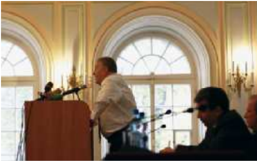
На фото: лидер ЛДПР за трибуной