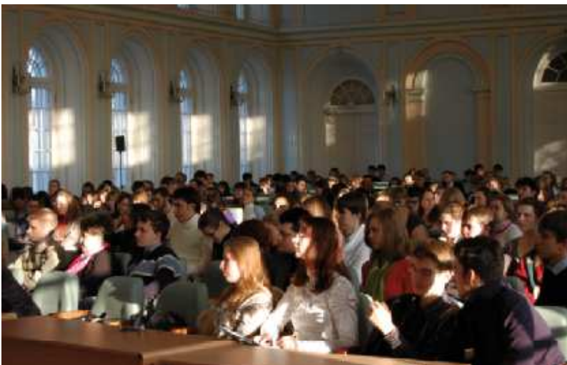
На фото: студенты и преподаватели СПбГУ внимательно слушают главу ЦИК РФ

Наверное, действительно, самое надежное средство для четкого разделения информации и агитации, о чем, среди прочего, шла речь на встрече, – это не хитрое законодательное размежевание близких понятий, а глубокое изучение вопроса и вдумчивый, беспристрастный анализ происходящего каждым из нас. ■