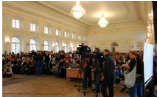
На фото: в фокусе внимания - лидер ЛДПР

Была затронута и тема «хорошего» политика и того, каким он должен быть. «Мудрый руководитель тот, при котором нет войны» - считает Владимир Вольфович, и такие великие деятели в истории России, как император Николай II и Иосиф Виссарионович Сталин, были ужасными правителями, так как вязали страну в Мировые войны, тогда как этого можно было и избежать. А вообще, «каждый политик должен быть и юристом, и