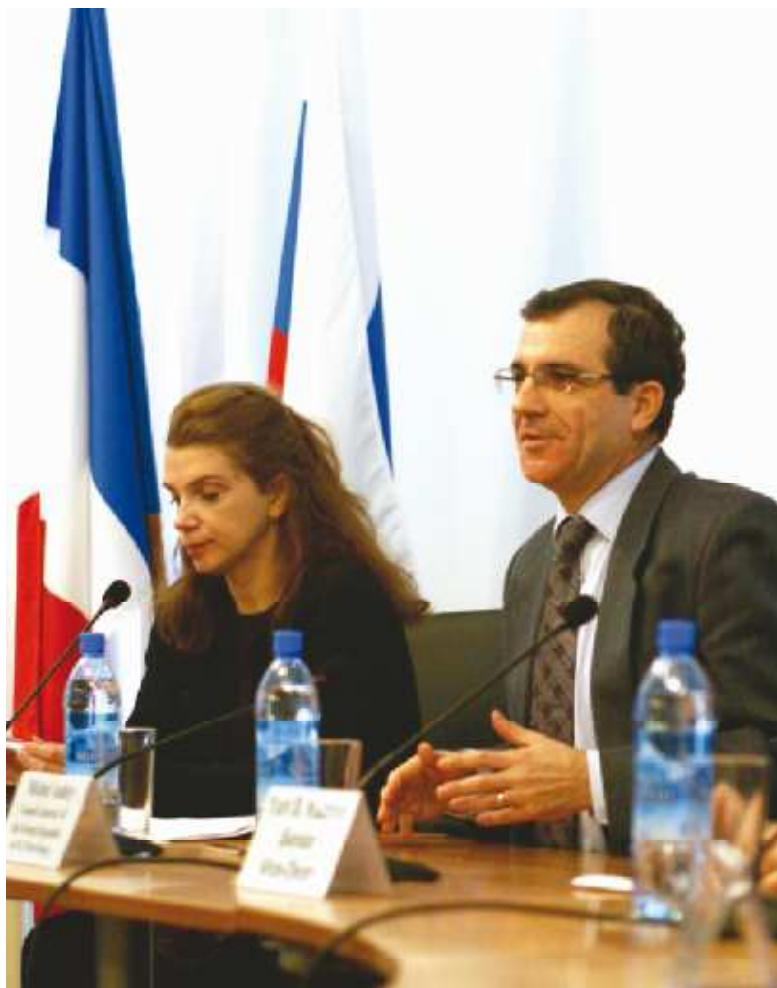
На фото: Генеральный Консул Франции в Санкт-Петербурге Мишель Обри

Факультет международных отношений Санкт-Петербургского государственного университета - один из ведущих ВУЗов Российской Федерации. Полученное здесь образование не сводится только к лекциям, семинарам и экзаменам. Каждый студент обладает уникальным шансом пообщаться с ведущими специалистами в области международных отношений и политики, теми людьми, которых мы все привыкли видеть в новостных лентах СМИ. Однако и в лекционных курсах факультет активно внедряет наиболее передовые образовательные методики. О том, как интересно учиться на факультете международных отношений, и какие высокие гости посетили нас в последнее время - читайте в номере.