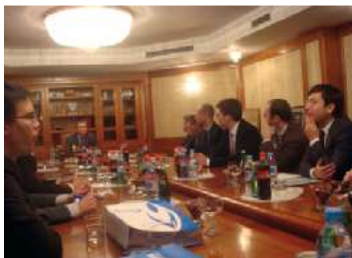
На фото: обсуждение на высшем уровне

..основной темой работы стали перспективы российско-германского сотрудничества..